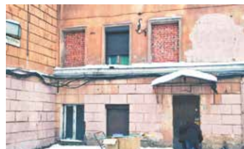
Закрашенные граффити на стене дома

На сегодняшний день несанкционированные надписи и рисунки с фасада здания по Транспортному переулку устранены.