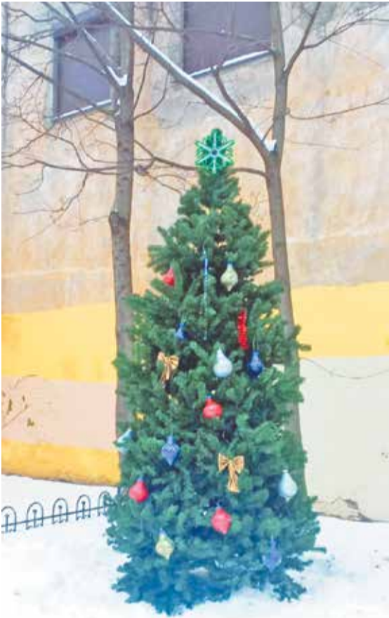
Новогодняя елочка на Миргородской улице

На территории округа появились украшенные новогодние елочки.