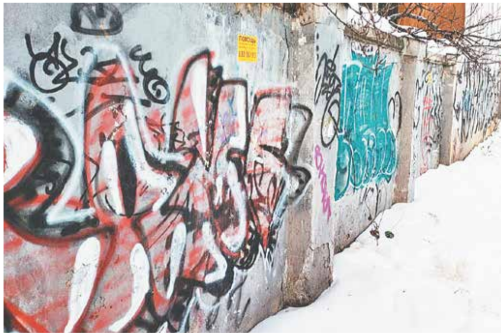
Граффити на заборе

Согласно статье 7.17 Кодекса об административных правонарушениях, уничтожение или повреждение чужого имущества, если эти действия не повлекли причинение значительного ущерба, влечет наложение