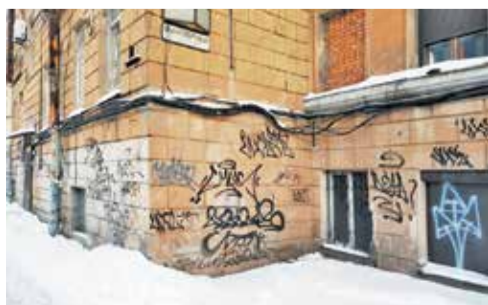
Стена жилого здания в Транспортном переулке