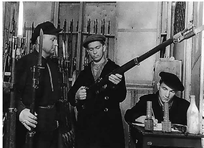
Народное ополчение. Школа № 168