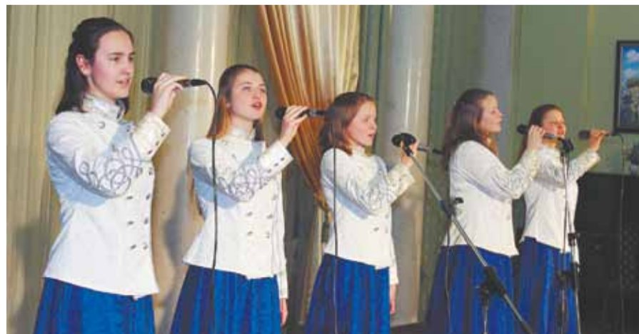
Вокальный ансамбль патриотической песни «Невский»