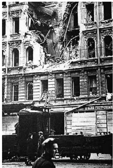
Попадание снаряда в дом № 119 по Старо-Невскому проспекту