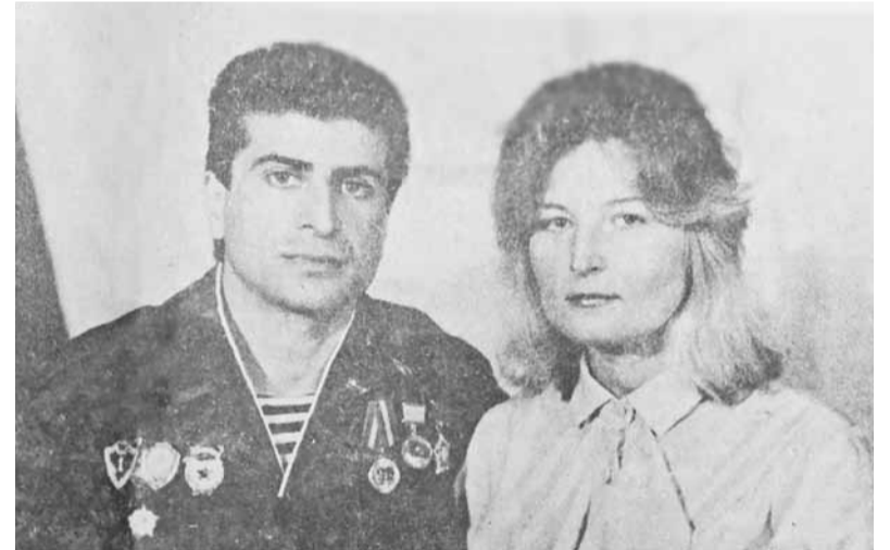
20 лет тому назад...

— Как сейчас помню тот день, — тепло улыбается женщина. — Я окончила то же училище, что и Азад, только выучилась на штукатура. До этого, правда, и режиссерское отделение в Краснодаре довелось окончить... Штукатурю я дверной откос, а в комнате работает смуглый, кареглазый красавец. В то время я увлеклась культурой Индии, индийским кино, а