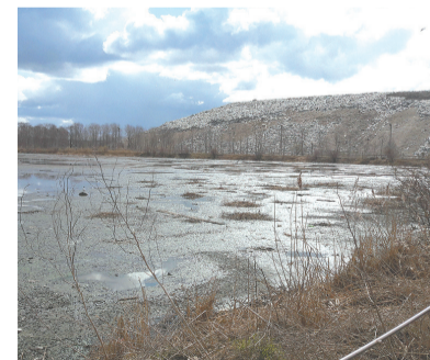
Вид на полигон «Новоселки»

С учетом значимости вопроса о качестве петербургского воздуха