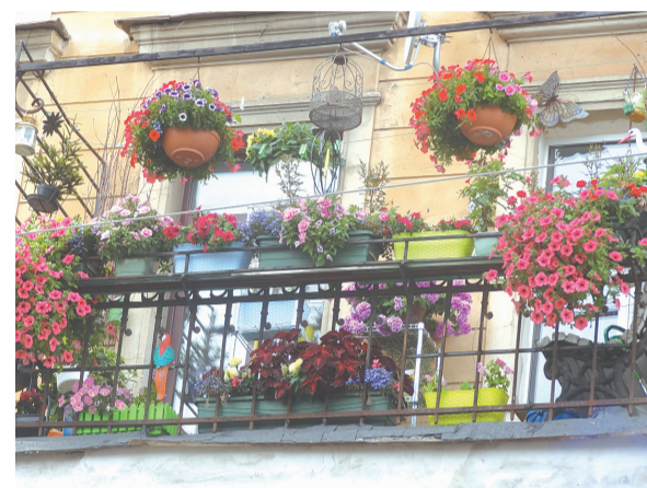
Лучший балкон по итогам 2016 года

выглядел первоначально и т. п.), можно представить на бумажном и электронном носителе в приемную местной Администрации Муниципального образования Лиговка-Ямская (Харьковская ул., д. 6/1, адрес электронной почты отдела: ma@ligovka-yamskaya.ru, тел. 717-87-44).