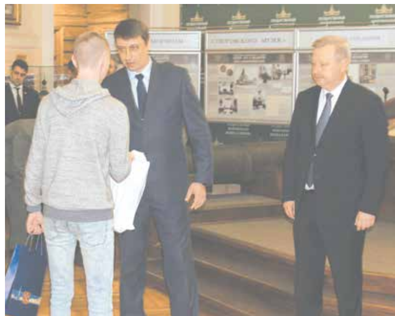
Торжественная отправка призывников на службу в ряды Вооруженных сил

Реализуя системный подход в области благоустройства территории Муниципального образования, считаю целесообразным продолжить обустройство контейнерных площадок, поскольку данный вопрос, остро вставший еще в 2018 году, до конца так и не решен. Кроме того, необходимо