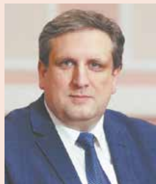
Глава администрации Центрального района Санкт-Петербурга М. С. Мейсин

От всей души желаю вам и вашим близким крепкого здоровья, счастья и семейного благополучия! С праздником!