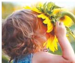
«Распускающихся почек слышу аромат...»

Так начинается одно из стихотворений русского поэта-сатирика конца XIX — начала XX в. С. Касаткина. Многие снисходительно отнесутся к «слышу аромат» в поэтическом творчестве, но почувствуют легкое раздражение, если встретятся с выражением «слышу запах» в повседневной