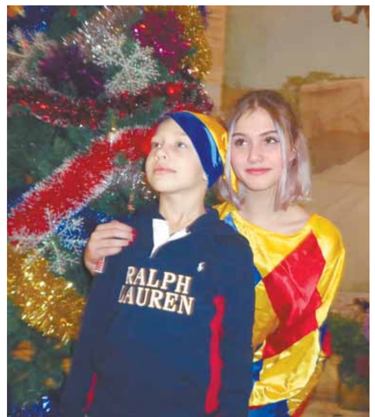
Наши жители в ДК Полиции на новогодних мероприятиях