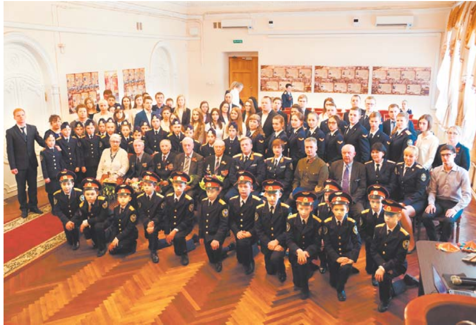
Встреча с ветеранами в ГСУ В День Победы

В этом году школа получила обновленное здание, ремонт длился четыре года, на открытии учащихся приветствовал губернатор Санкт-Петербурга Георгий Сергеевич Полтавченко, а осенью здесь ждут в гости председателя Следственного комитета Александра Ивановича Бастрыкина. С высшим ведомством кадет объединяют не только тесные взаимоотношения и преподаватели, которые читают в школе профильные предметы, но и форма — она такая