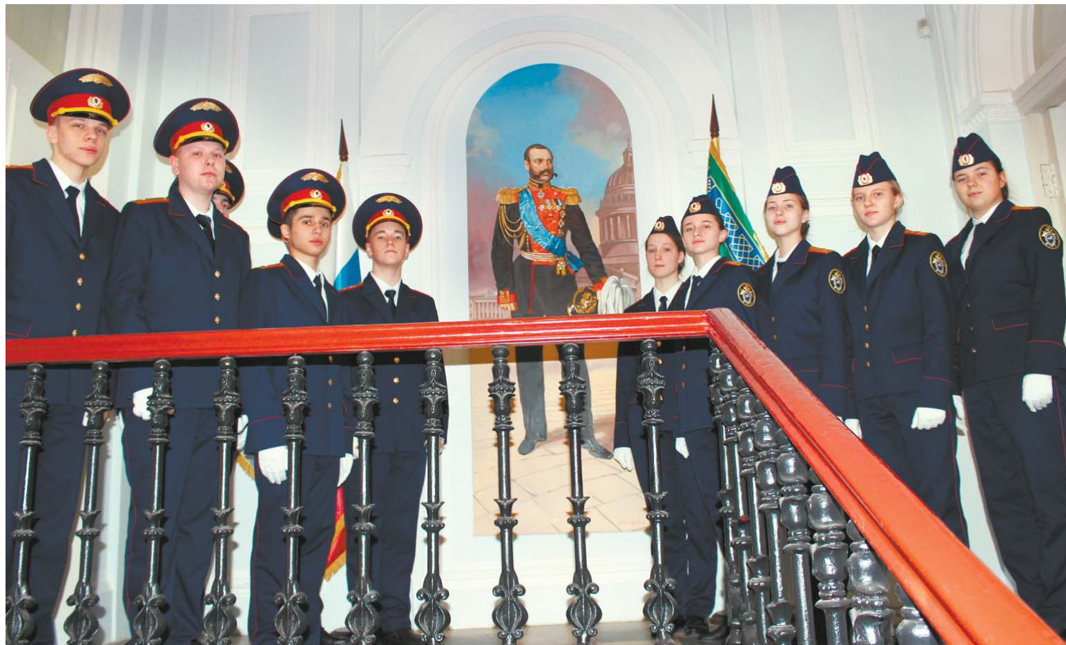
Учащиеся школы № 304 Центра подготовки кадет на торжественной церемонии

Особенная школа № 304 расположена на территории Муниципального образования Лиговка-Ямская. Это единственное в России учебное общеобразовательное учреждение, где ребята не просто обучают общеобразовательным предметам, но одновременно в Центре подготовки кадет дают правовые знания и дисциплинарную основу.