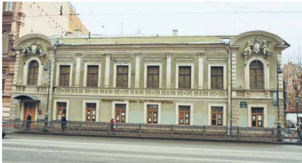
Центральная библиотека им. М. Ю. Лермонтова. Литейный проспект, 17-19

15 октября в 19.00 в Белом зале Центральной библиотеки им. М. Ю. Лермонтова студенты Ленинградского областного колледжа культуры и искусства покажут поэтическое