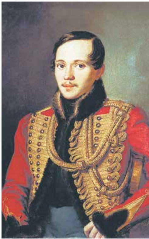
М. Ю. Лермонтов

13 октября в Белом зале Центральной библиотеки им. М. Ю. Лермонтова гостей ждет