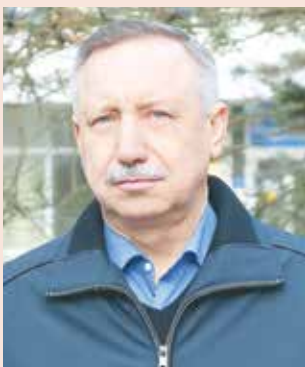
Губернатор Санкт-Петербурга Александр Беглов

Обращаюсь ко всем жителям Петербурга: оставайтесь дома, не выходите на улицу без крайней необходимости! Позаботьтесь о своих близких!