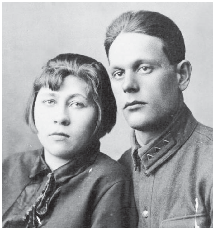
Родители Нелли Ивановны