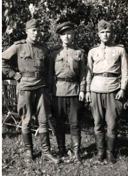
Однополчане в День Победы. 1945 год