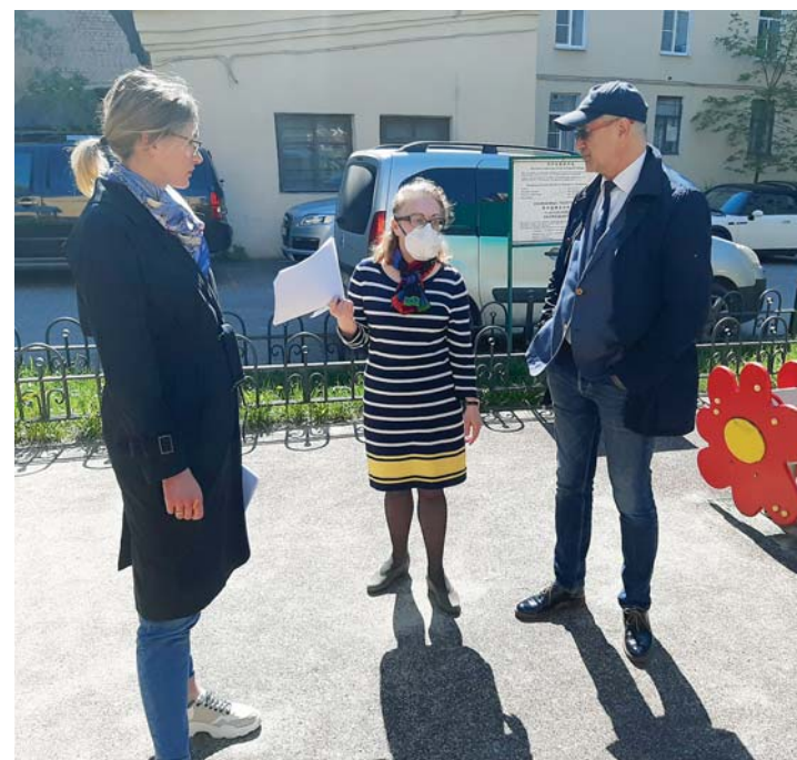
Обсуждение благоустройства по адресу: Миргородская ул., 10-12